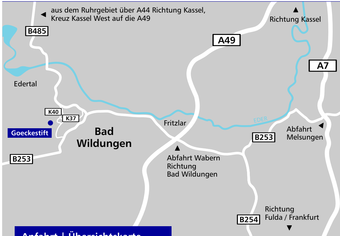
Anfahrt | Übersichtskarte